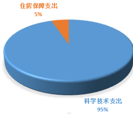
(财政拨款支出(类)占比饼状图)